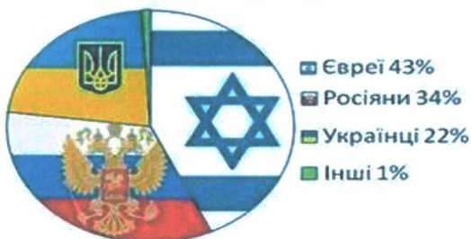
Верховна Рада України