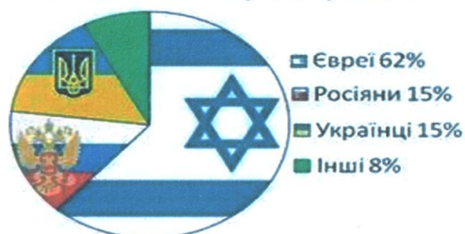
Кабінет міністрів України