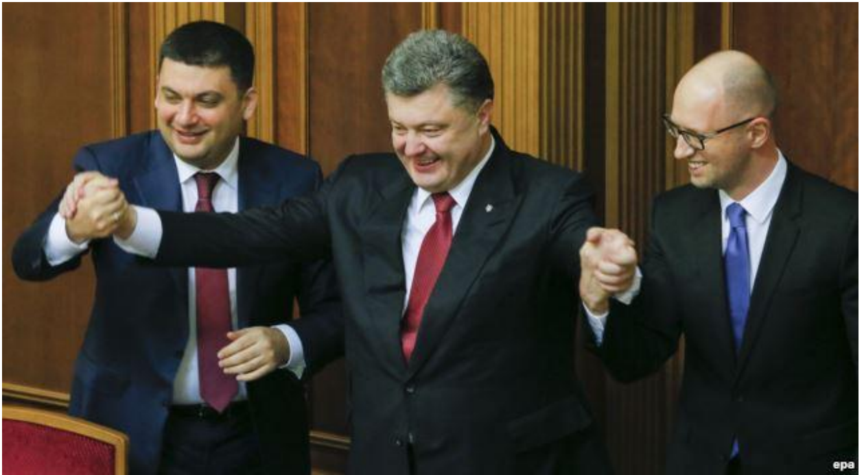
Керівники «Єдиної країни» - українці: В.Гройсман, П.Порошенко, А.Яценюк під час першого засідання Верховної Ради України VIII скликання (27.XI. 2014 р.)